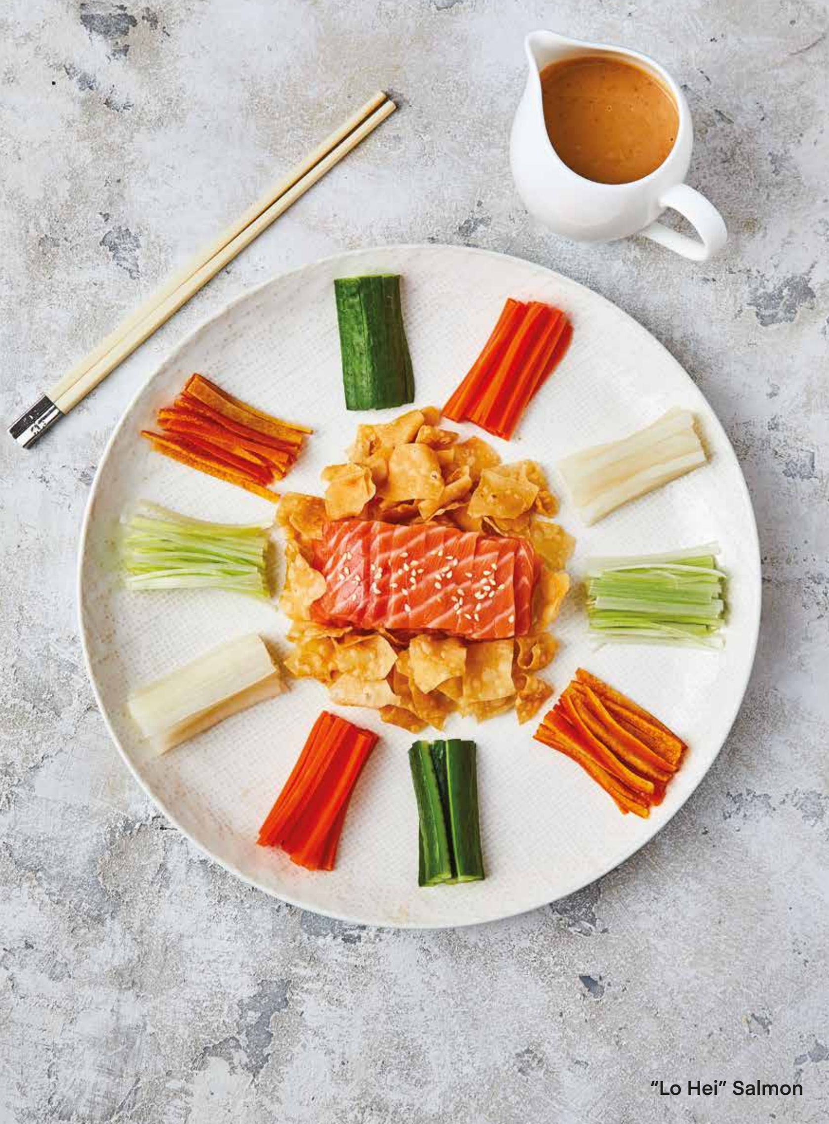
"Lo Hei" Salmon